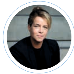
Mona Neubaur (Ministerin für Wirtschaft, Industrie, Klimaschutz und Energie, Mdl. des Landes Nordrhein-Westfalen)

Was hier mit der Region auf die Beine gestellt wurde, ist wirklich beeindruckend. Davon konnte ich mir im Rahmen der „Coworking-Tour“ in Werdohl auch selbst ein Bild machen. Mein Dank gilt allen Beteiligten für ihr Engagement.